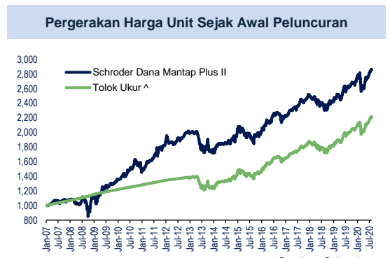
Pergerakan Harga Unit Sejak Awal Peluncuran