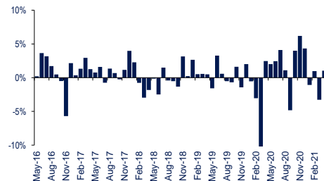
Kinerja Bulanan Selama 5 Tahun Terakhir